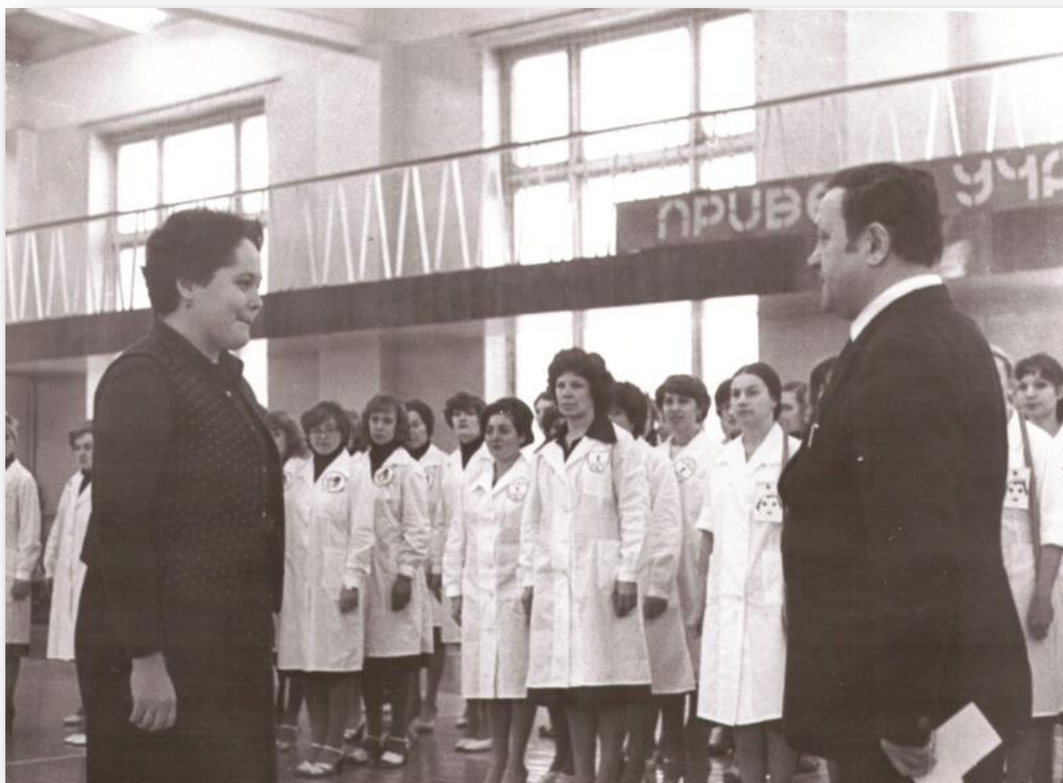
Соревнования медицинских работников по производственной гимнастике, 1981 г.