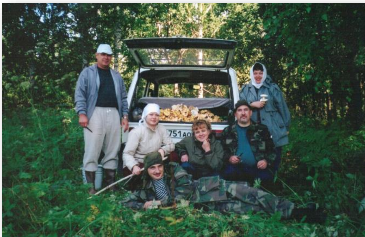
Тяжинский район, 2003 г.